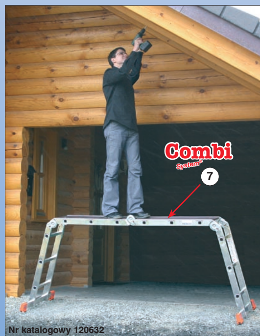
Nr katalogowy 120632