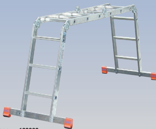
Nr katalogowy 120632