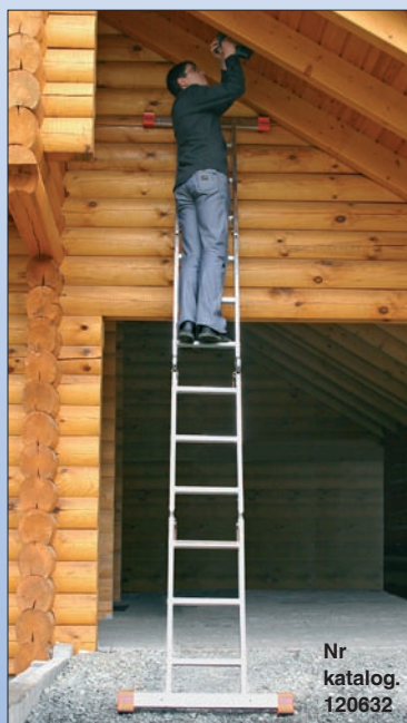
Nr katalog. 120632