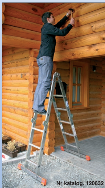
Nr katalog. 120632