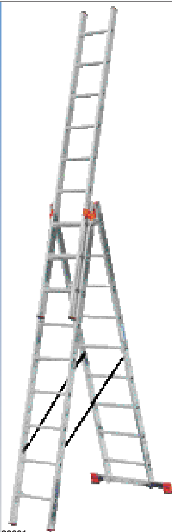
Nr katalogowy 120601