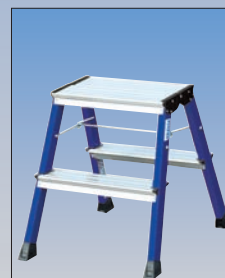
Nr katalogowy 130082