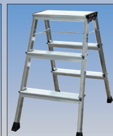
Nr katalogowy 130068