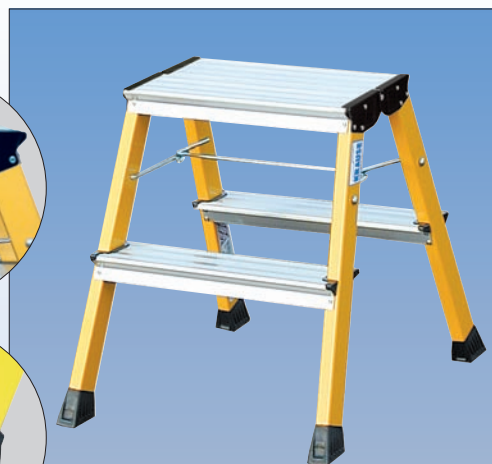
Nr katalogowy 130044