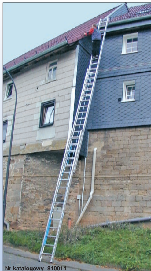
Nr katalogowy 810014